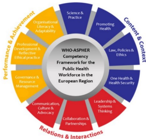
Fig. 2. The 10 sections of the WHO-ASPHER Competency Framework for Public Health in the European Region